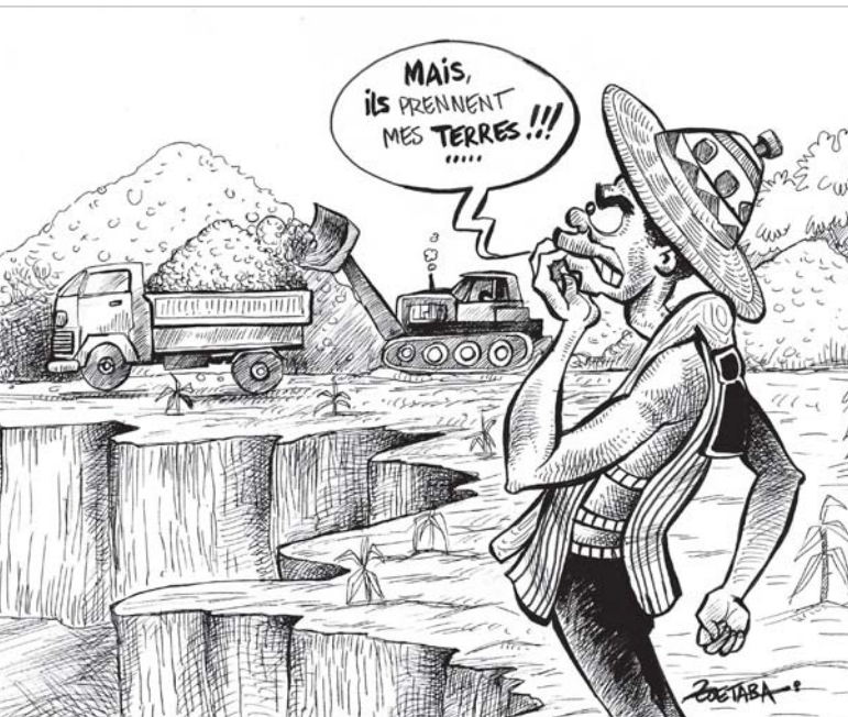
Illustration mise à disposition par Inter-réseaux – Développement rural, tirée de : La quête des terres agricoles en Afrique subsaharienne / V. Basserie, H. M.G. Ouédraogo. – Grain de sel n° 45 – Février 2009, www.inter-reseaux.org/IMG/pdf_56initiative.pdf