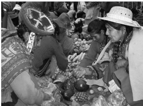
Marché local de Lares, Province de Cuzco, Pérou.

Towards food sovereignty: reclaiming autonomous food systems. Michel Pimbert. IIED. 2008. 58 p. www.iied.org/pubs/pdfs/G02268.pdf