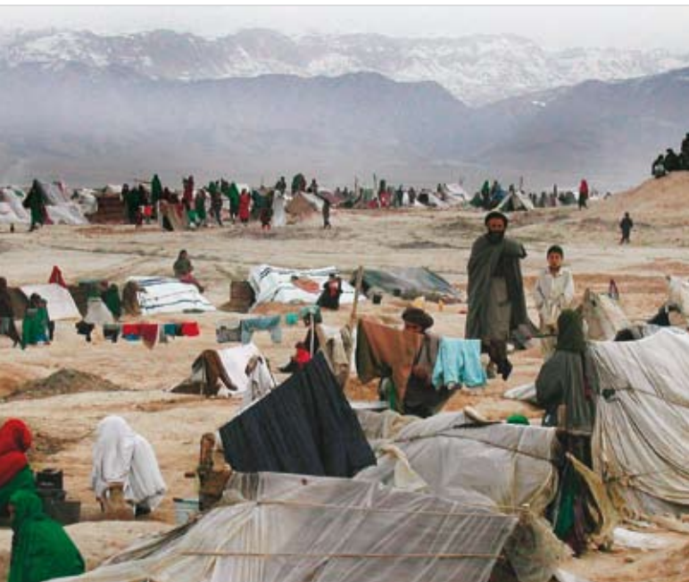
Selon l'Organisation internationale pour les migrations, les populations du sud de l'Afghanistan ont fui avant tout la sécheresse, et en second lieu les conflits.