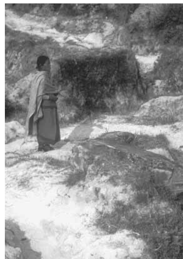
Illustration de la page de couverture : Améliorer la gestion des ressources naturelles et en même temps réduire la pauvreté ; les CSE peuvent-elles y contribuer ? Bassin de Dhulikel, Nepal.